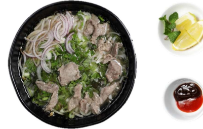
Pho Bo - Vietnamesische Nudelsuppe mit Rindfleisch