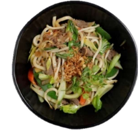
Udon Bo - Udonnudeln mit Rindfleisch