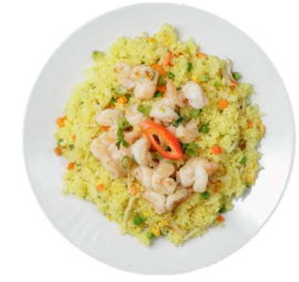
Com Chien Tom - Gebratener Reis mit Garnelen