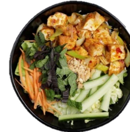
Bun Tofu Xa Ot - Reisnudeln mit in Zitronengras und Chili gebratenem Tofu