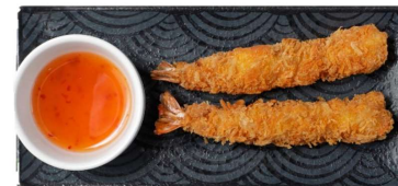
Tom Xu - panierte Black-Tiger-Garnelen