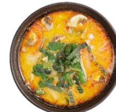
Tom Kha Gai - Kokossuppe