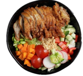
Poké Bowl mit knuspriger Ente