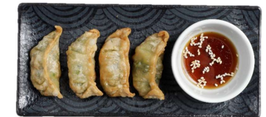
Ha Cao Tom - Garnelen-Gyoza