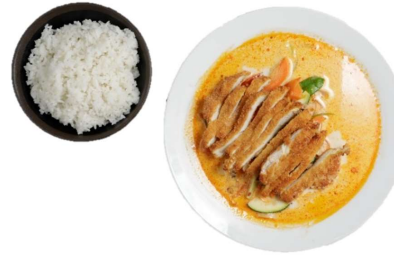
Jasminreis mit Paniertem Hühnerfilet und Thai-Rot-Curry-Soße