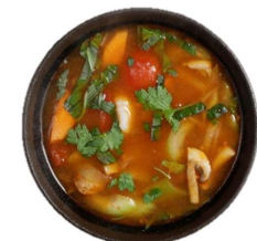
Tom Yam Gung