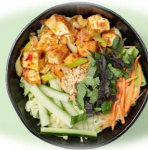
Bun Tofu Xa Ot