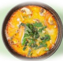
Tom Kha Gai