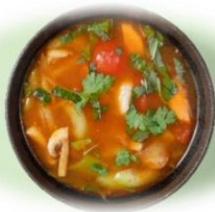
Tom Yam Gung