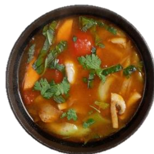
Tom Yam Gung