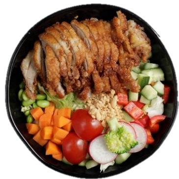
Poké Bowl mit Knuspriger Ente