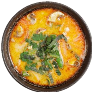
Tom Kha Gai – Kokossuppe