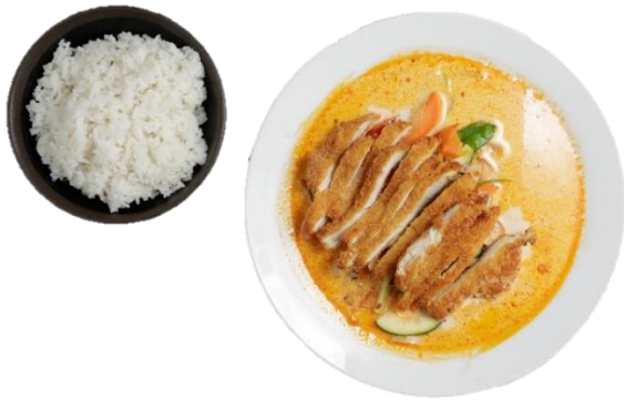
Jasminreis mit Paniertem Hühnerfilet und Thai-Rot-Curry-Soße