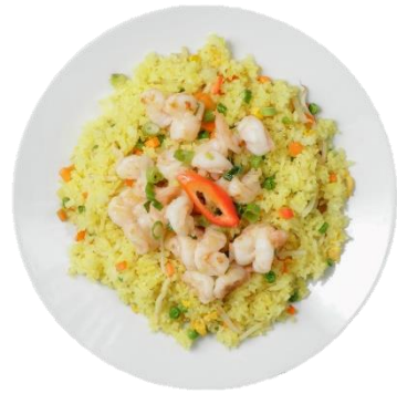
Com Chien Tom – Gebratener Reis mit Garnelen