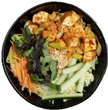
Bun Tofu Xa Ot – Reismudeln mit in Zitronengras und Chili gebratenem Tofu