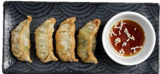
Ha Cao Tom – Garnelen-Gyoza